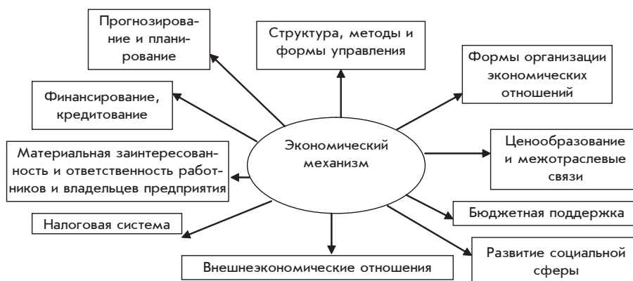
Рис. 1. Основные элементы экономического механизма АПК

В целом коммерческий расчет можно представить как экономику конкретного предприятия, которая включает ресурсы, организацию управления и производства, финансовые рычаги — налоги, дотации, кредиты, страхование, а также финансовые результаты (рис. 2).