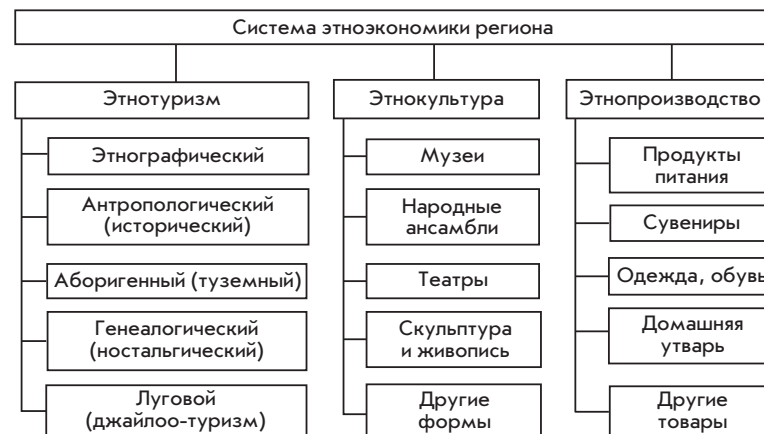
Рис. 2. Основные элементы этноэкономики региона

Для Республики Бурятия очевиден высокий потенциал во всех секторах этнического туризма, к которым в современных исследованиях относят этнографический, антропологический, аборигенный, ностальгический и «луговой» туризм [14]. Ярким примером эффективного использования потенциала этнотуризма является Монголия, где в последние годы резко возрос вклад туристической отрасли в валовой внутренний продукт. Туристский маршрут «Легенды Бурятии», включающий поездку в Иволгинский дацан, Ацагатскую долину и на побережье озера Байкал, вошел в число 8-ми российских проектов, отобранных Министерством культуры России для дальнейшей разработки. Бурятия имеет большие возможности практически во всех направлениях этнического туризма, например, создание этно-познавательного маршрута «Люди у Байкала — сплав поколений», который включает следующие темы: древние поселения — гунны; Чингисхан; Ермак (казаки); буддизм (дацаны, святые места); старообрядцы; декабристы; золото-промышленники и т. д.