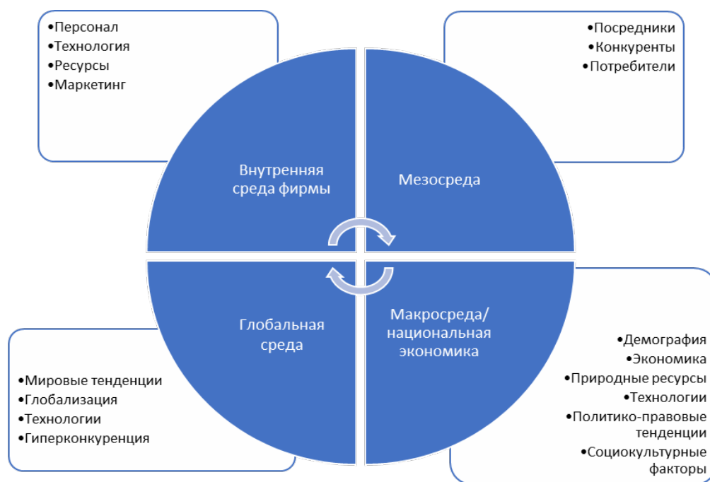
Рис. 1. Подходы в исследовании трендов в развитии туризма и гостеприимства в мире, России и Прибайкалье