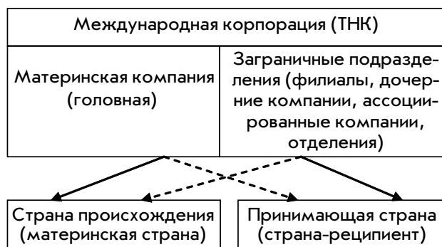
Рис. 1. Взаимодействие стран и международных корпораций

– международная корпорация (чаще заграничные подразделения ТНК) — принимающие страны (правительства стран-реципиентов) (рис. 1).